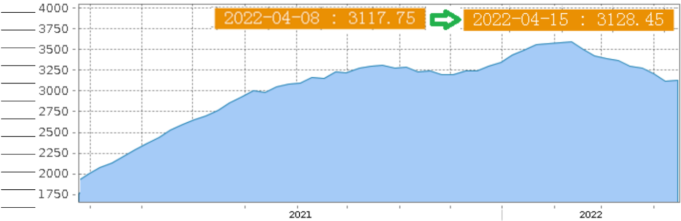
グローバルコンテナインデックス Freightos Baltic Index (FBX): Global Container Freight Index https://fbx.freightos.com/